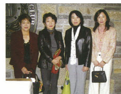
【4位】ミレニアム会 パートII