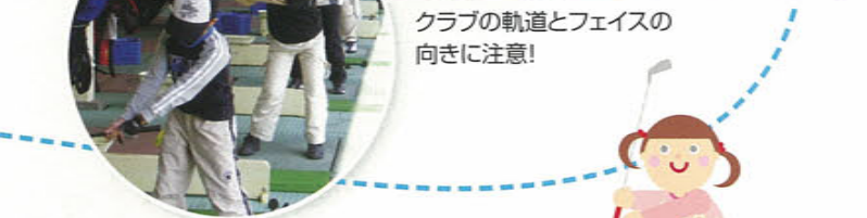
クラブの軌道とフェイスの向きに注意!