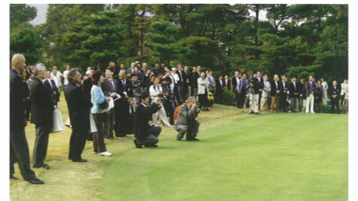
大ギャラリーが見守る中での表彰式