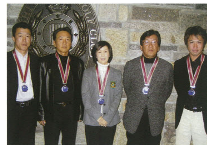
【2位】関西クラシック