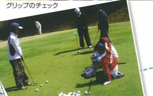
グリップのチェック