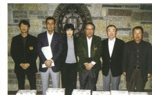
【5位】鳴尾ゴルフ倶楽部