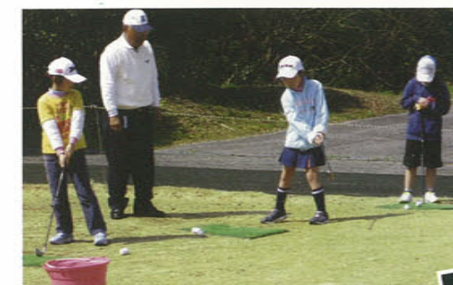
シニアゲーム中心のアプローチ指導