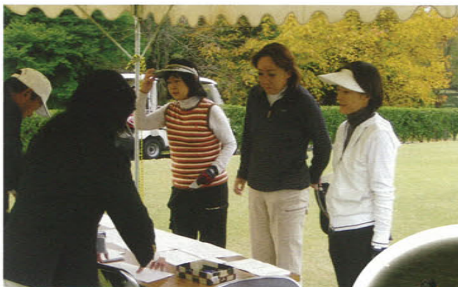
緊張ただよいながら競技委員の話聞く