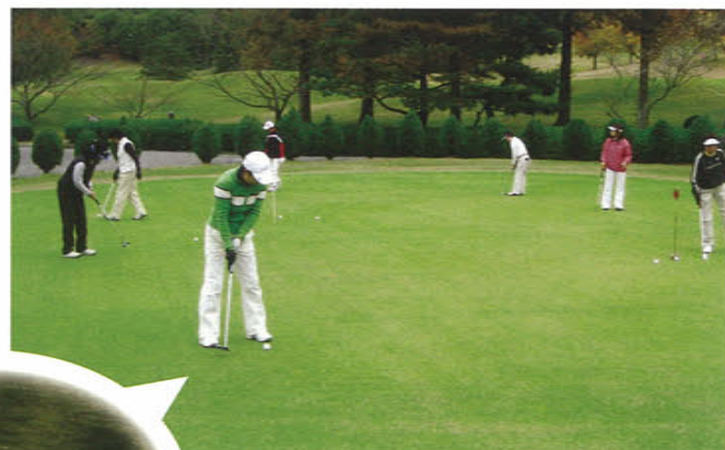
バッティングを観るアヒル夫婦