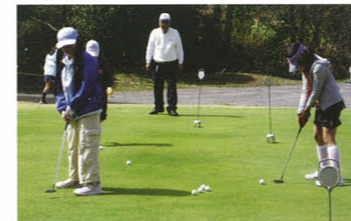
メンタル面指導後のパッティング練習