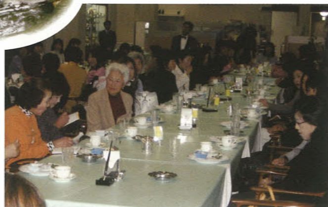
涙汗の懇親会(西脇カントリークラブ)