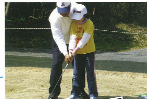
きめ細やかな個人指導も行う。