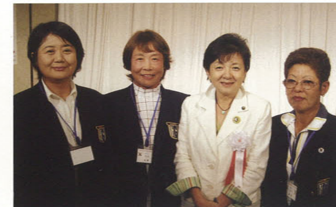
滋賀県 嘉田 由紀子 知事の激励の1シーン