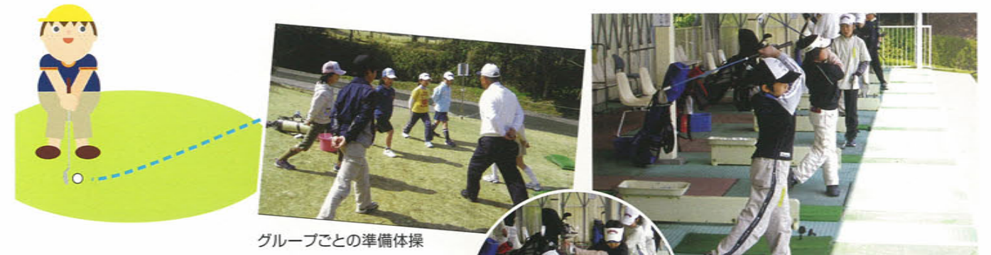
グループごとの準備体操