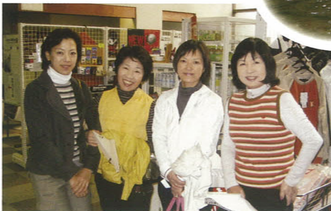
レディース大会で仲間が増えました