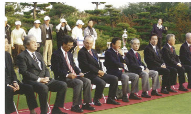
「のじぎくオープン選手権大会」表彰式会場(宝塚ゴルフ倶楽部)