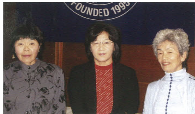
ハンディの部の入賞者