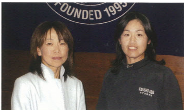
グロスの部の入賞者