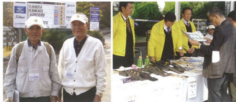
ボランティア活動、協賛ショップ