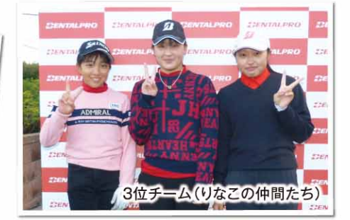
3位チーム(りなこの仲間たち)