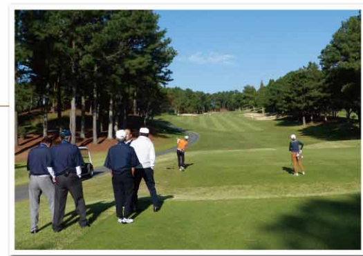
緊張のティーショット