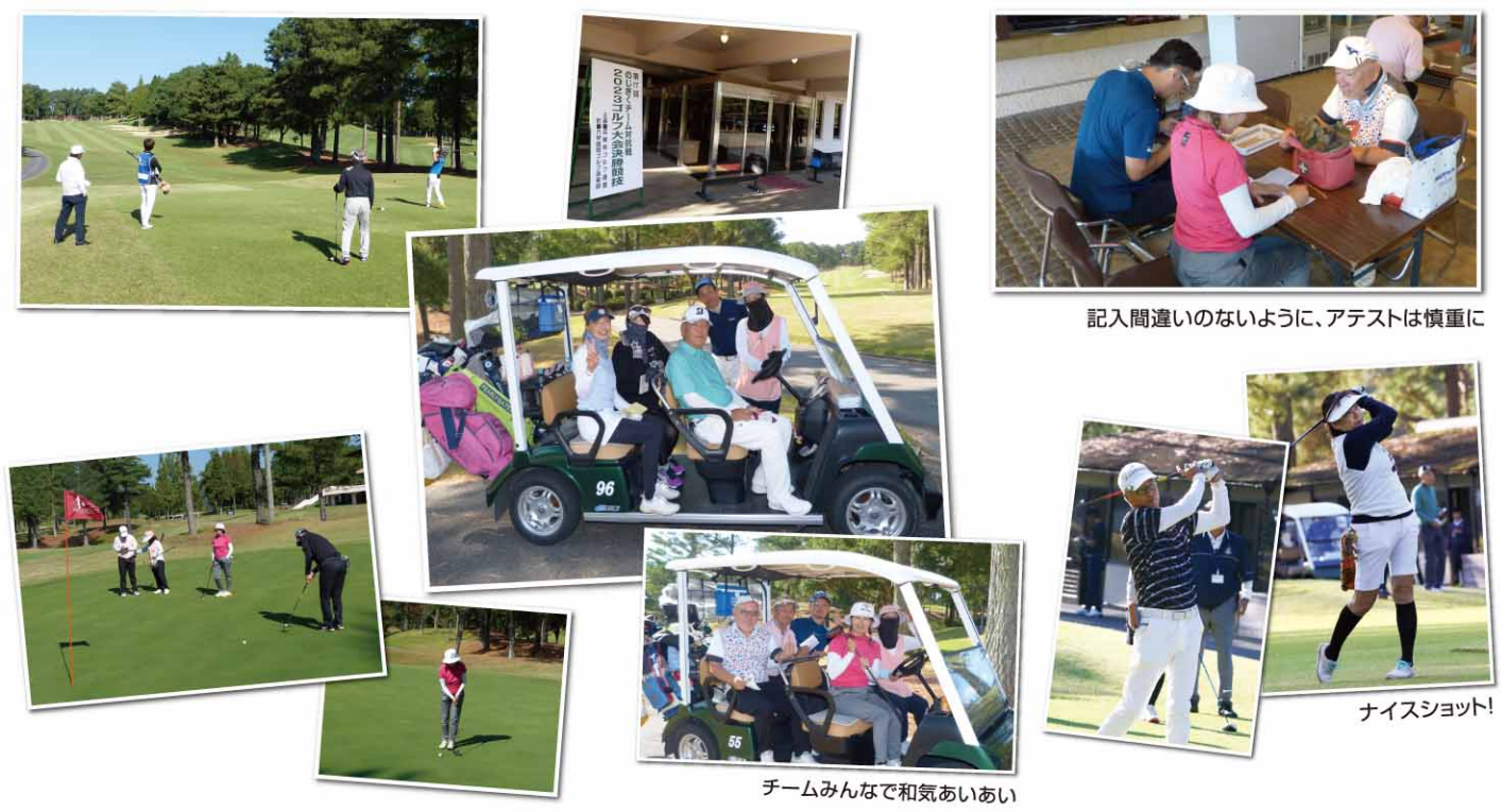
記入間違いのないように、アテストは慎重に