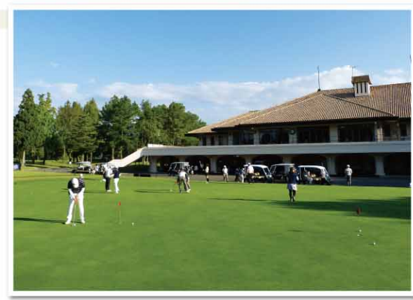
パットの練習にも熱気が感じられます

決勝 10月16日(月) 六甲国際ゴルフ倶楽部 東コース 【20チーム(総人数119名、男子86名、女子33名)】 ●表彰/ 【団体】優勝～5位、【個人】優勝～10位、ベストグロス賞