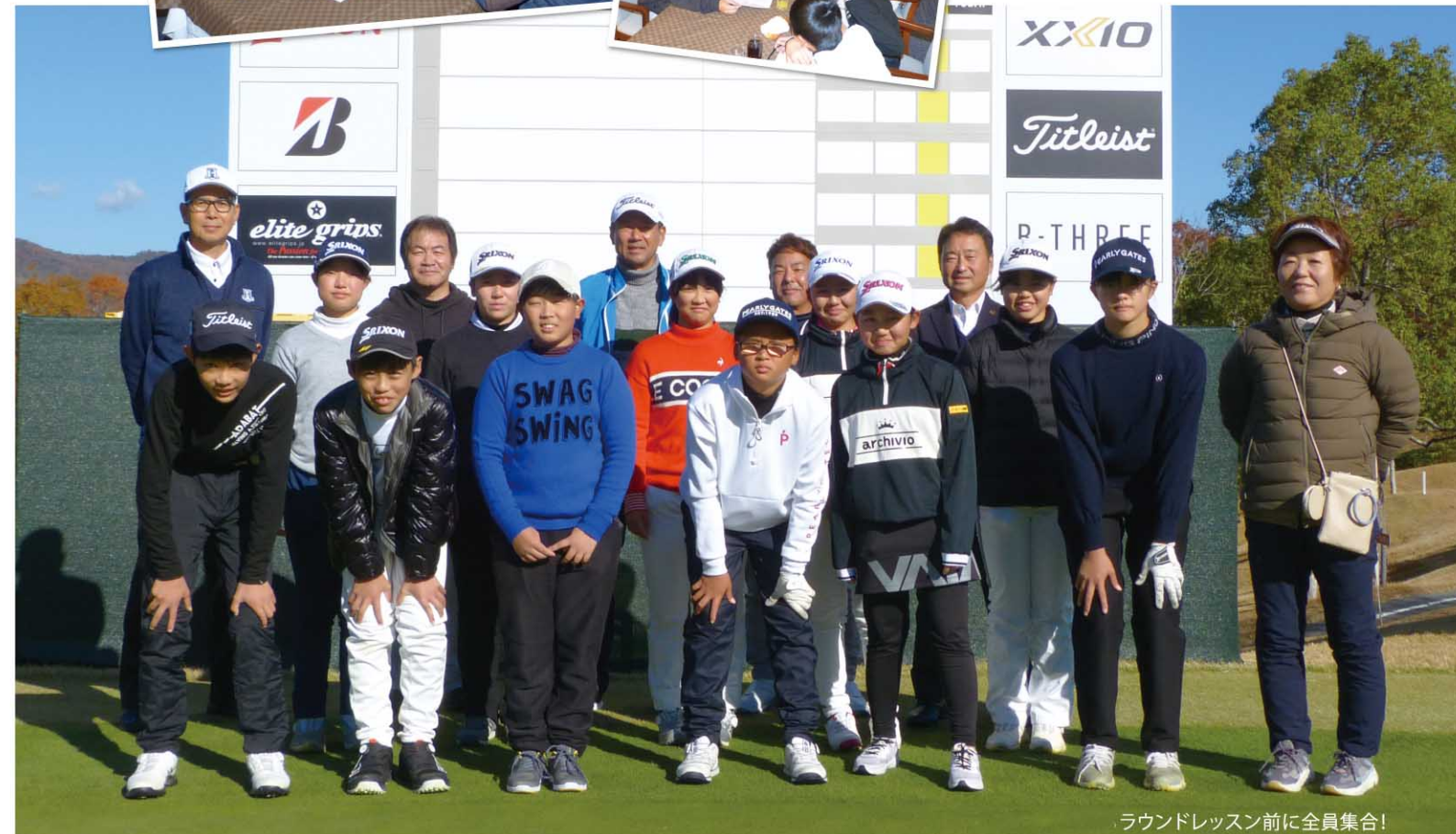
ラウンドレッスン前に全員集合!