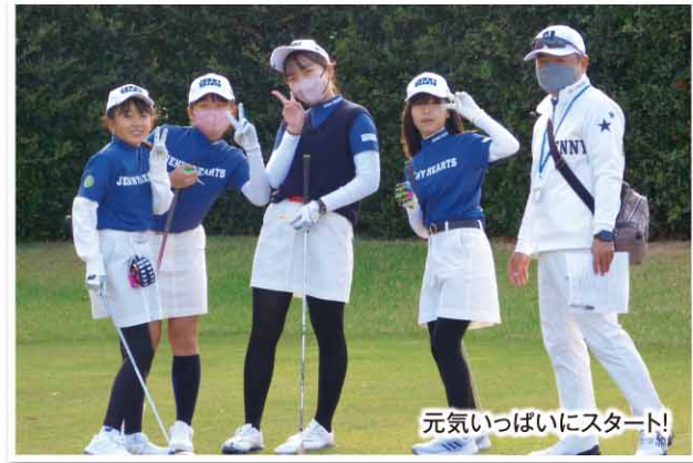
元気いっぱいにスタート!