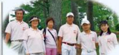
胸のマスコットの刺繍も愛らしく