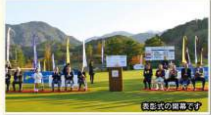
表彰式の開幕です