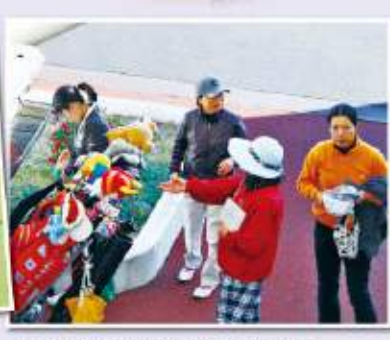
今冬1番の冷え込みの中お疲れ様