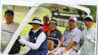
フロント9を終えてこの笑顔