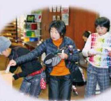
署名もれ(規則6-6)で失格にならないよう最後まで慎重に!!