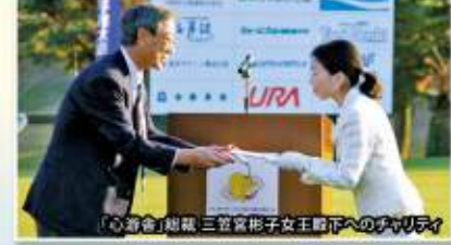
「心游舎」総裁 三笠宮彬子女王陛下へのチャリティー