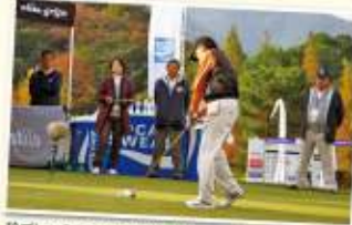
珍プレー? ティバックより落下のボールをナイスショット!!