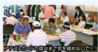
アテストカードの提出まで気を緩めないで!!