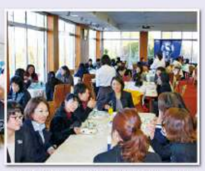
成績発表までゴルフ談義でワイワイ...