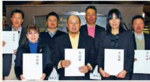
【3位】丹波市ゴルフ協会