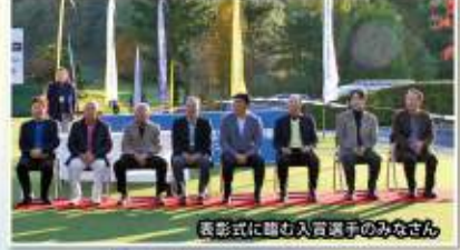
表彰式に臨む入賞選手のみなさん