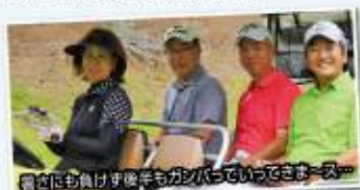
雲雀にも負けず後半もガンバっていきまーす