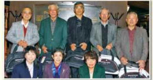
【4位】西宮市ゴルフ協会