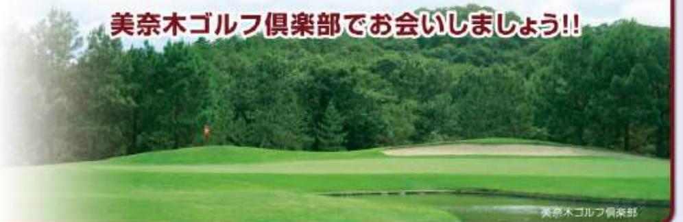
美奈木ゴルフ倶楽部