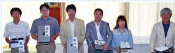
【4位】東条の馬鹿な兄弟達