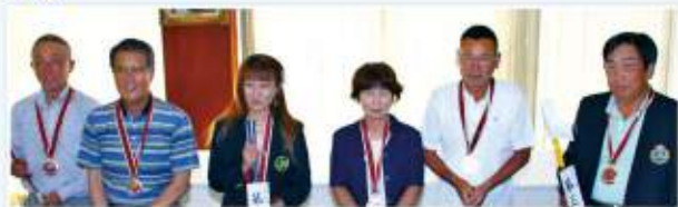
【3位】オールチェリーズ