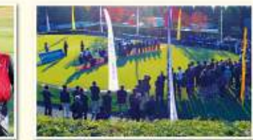
大勢のギャラリーの中、表彰式を終えました