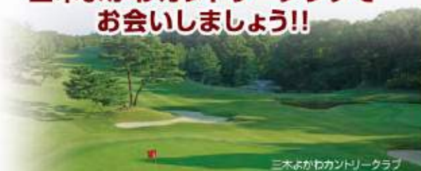
三木よかわカントリークラブ