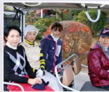
前半のラウンドを終えてほっ。