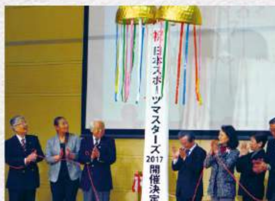
井戸兵庫県知事と競技団体関係者による「2017兵庫大会」決定の祝賀、クス玉割り!!