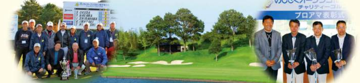
奥田プロを囲んで大会を支えたボランティアの皆さん