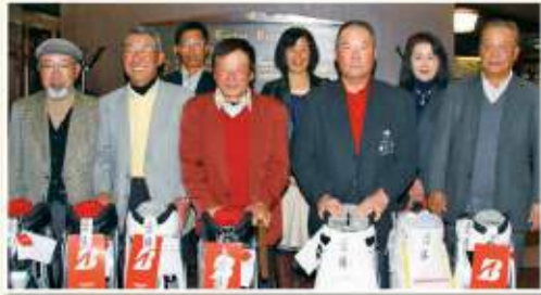
【2位】小野市ゴルフ協会

13チーム 103名【男子】76名 【女子】27名 男子 6,225yard 女子 5,630yard コースレート 71.0