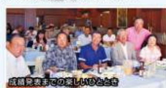
成績発表までの楽しいひととき