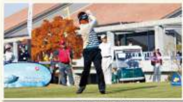
奥田プロの豪快なフィニッシュ