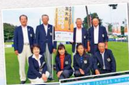
兵庫県代表選手団

2014年9月17日(水)~19日(金) 【男子】霞ヶ関カンツリー倶楽部 【女子】霞ヶ関カンツリー倶楽部