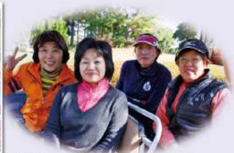
バック9もガンバッテ!!