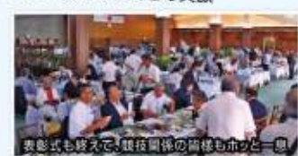
表彰式も終えて、競技開始の前様もホッと一息!