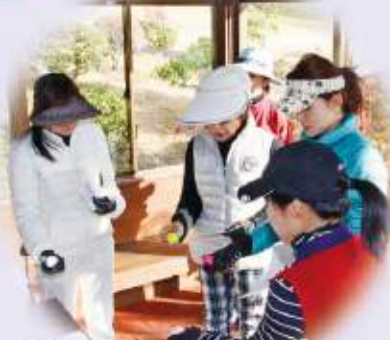
女性のボール確認もカラフルでオシャレ