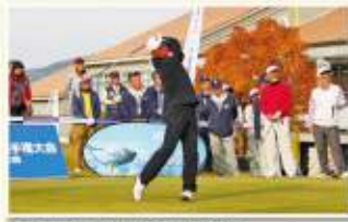
井戸木プロの曲がらない球筋