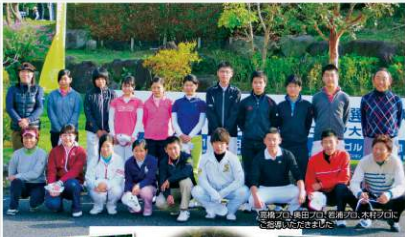
嘉橋プロ、奥田プロ、若浦プロ、木村プロにご参画いただきました。