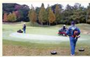
No.18グリーンでの早朝の整備